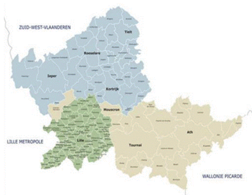
2. ábra A Lille-Kortrijk-Tournai Eurometropolisz települései 7

Az Eurometropolisz földrajzi területe 3550 km 2 , ahol mintegy 2 millió főnyi lakosság él. A határmenti régió a franciaországi Nord-Pas-de-Calais, illetve a nyugat-flandriai (West-Vlaanderen) és a vallon Hainaut NUTS 2 régiókhöz tartozik, míg a NUTS 3 szinten a francia Nord „megyét” (département), illetve négy-négy flamand és vallon (Ieper, Kortrijk, Roeselare, Tielt, Ath, Mouscron, Tournai, Soignies) „körzetet” (arrondissement) találunk. Míg lokális szinten 147 településről beszélhetünk. A 87 franciaországi település együttesen a kb. 1,1 milliányi lakosságnak otthont adó Lille Metropoliszt (Lille Métropole) alkotja, ebből Lille városa mintegy 230 ezer fővel részesedik. 5 A 60 belgiumi település összlakossága kb. 950 ezer fő, ebből Kortrijk 75 ezer főt, míg Tournai 70 ezer főt ad (lásd 2. ábra). 6